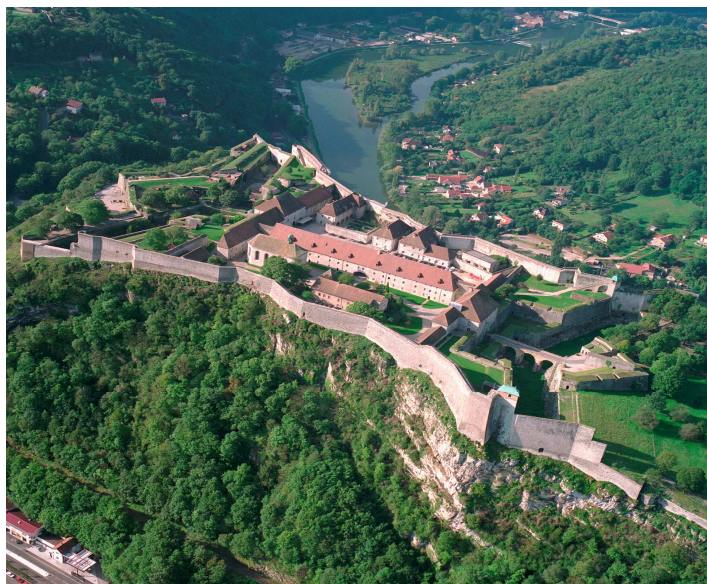
La Citadelle

Le 12 ème colloque de l'ADEREST se déroulera les 16 et 17 mars 2009 à Besançon